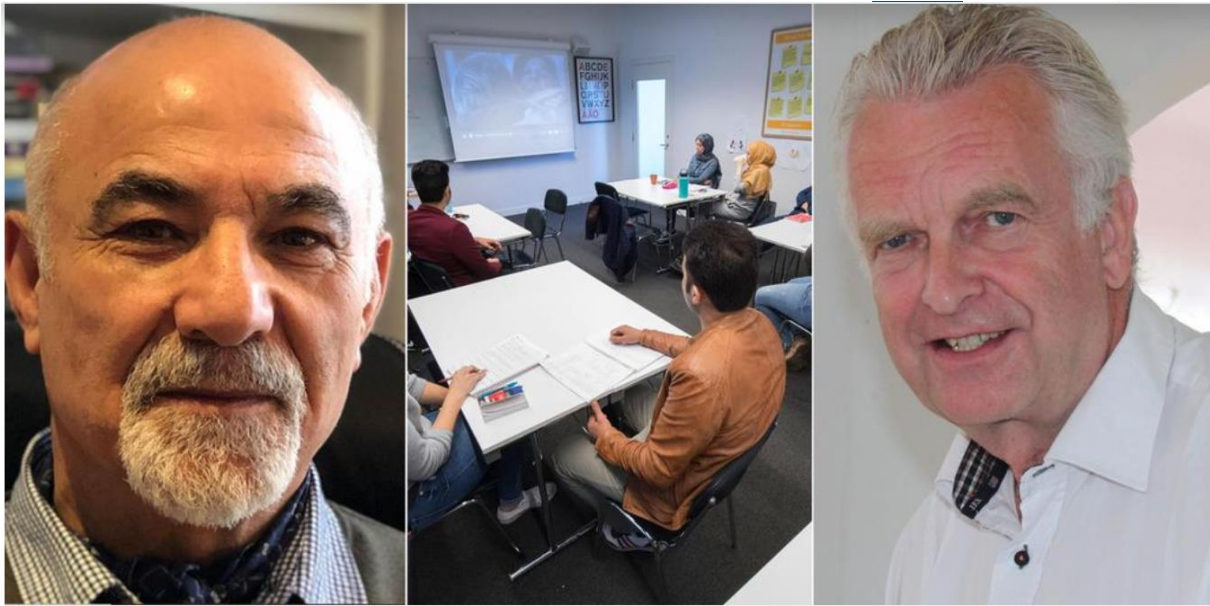
Språktest inom vård och förskola ställer ökade krav på svenskundervisningen för utlandsfödda, menar debattörerna.